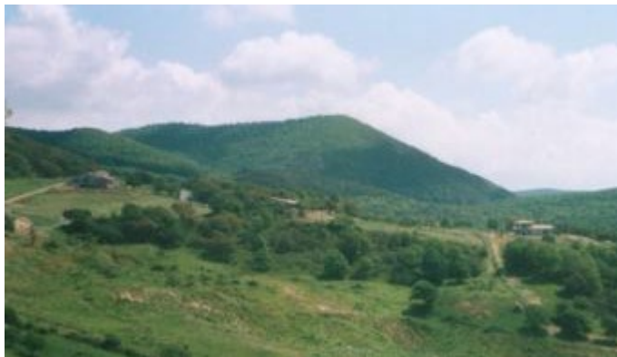
Panorama di Monte Santo visto dal Monte Sassone