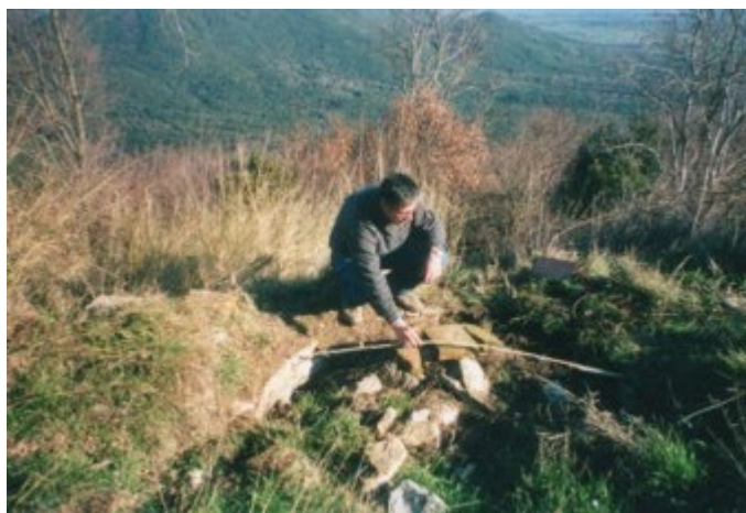
Analisi di un struttura sulla cima di Monte Santo.