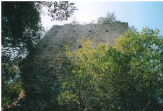
Torre Nord nella zona A del castello di Monte Sassone vista dal basso.

3 metri di spessore, e da pareti di roccia a strapiombo che fungono da difesa naturale. Ad intervalli regolari sono distinguibili delle torri delle quali una ben conservata alta circa 8 metri. Su tutto il pianoro si riconoscono tracce di strutture tra cui una più evidente che doveva appartenere alla rocca principale del castello.