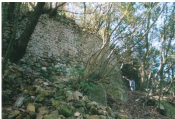
Tratto delle mura nella zona B del castello di Monte Sassone.

La zona C: interposta tra la zona A e B, si trova una piccola valle con tracce di strutture murarie. Ai lati più corti, meno difendibili, sono presenti delle mura di notevole spessore, che unificano tutto l'abitato in un'unica complessa area fortificata che comprende le zone A, B e C (vedi pianta a lato). Al centro della valletta resti di muri absidati appartengono sicuramente ad una piccola chiesa cimiteriale, visto che nelle immediate vicinanze si trovano, ricavate in uno sperone di roccia, una serie di piccole tombe a fossa che, dalla forma antropomorfa, potrebbero appartenere al periodo longobardo. 4